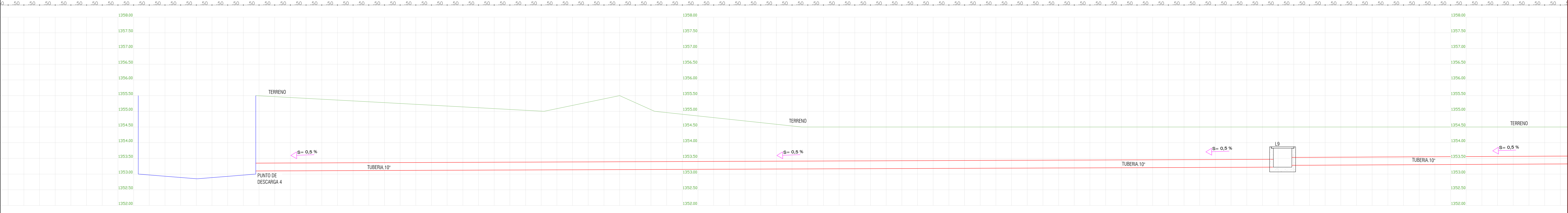
PUNTO DE DESCARGA 4. ESC: 1:50